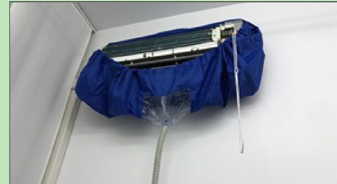
Nella foto: l'operazione viene fatta in completa sicurezza e senza sporcare muri o pavimenti.

Qui introduco il terzo ed ultimo motivo.