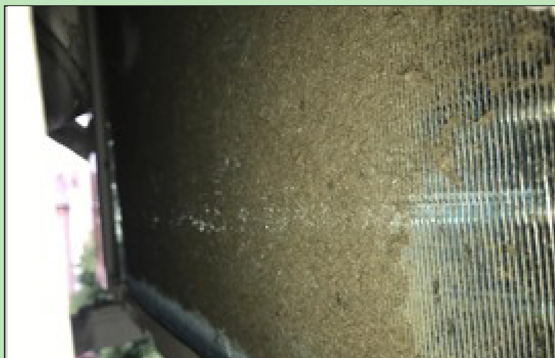
Nella foto: esempio di cosa potresti trovare nel radiatore del tuo condizionatore.

Basta premere il tasto del telecomando e tutto il calore, il sudore e il fastidioso caldo sparisce.